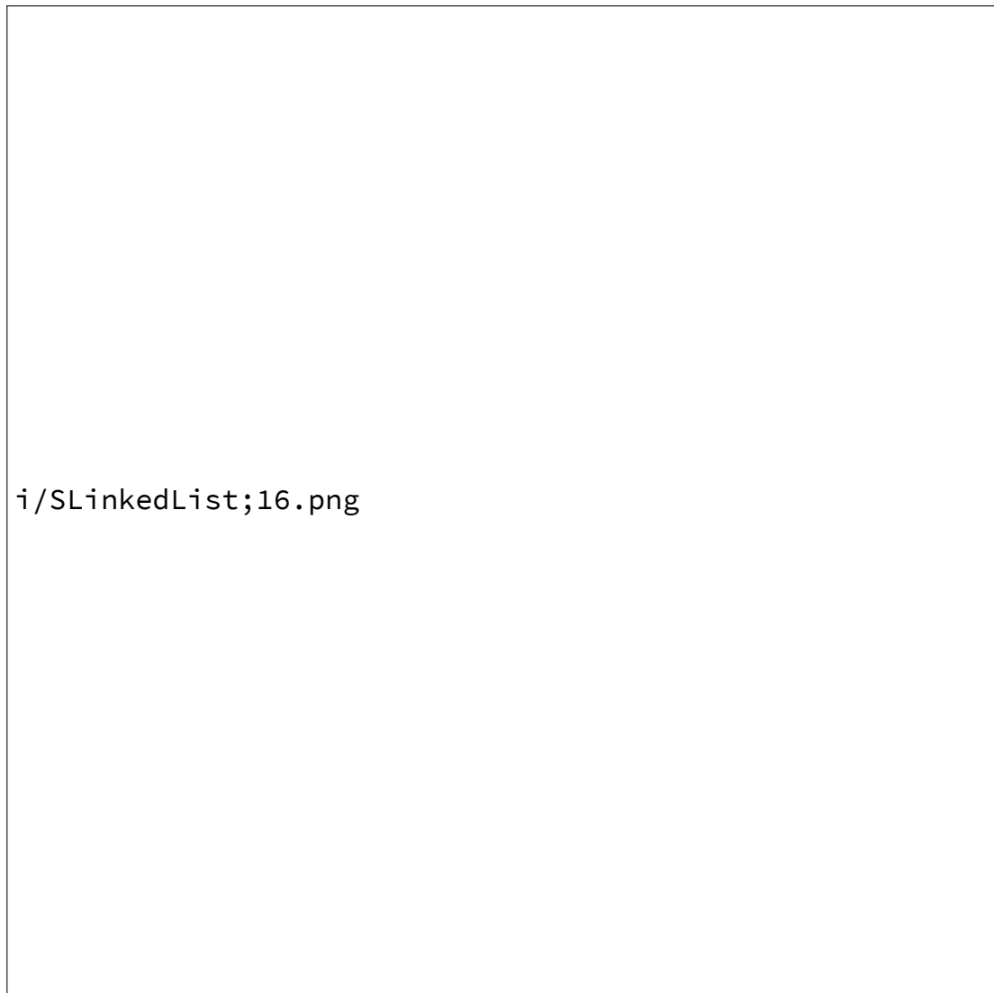
Fig. 2 : Liste (simplement) chaînée des jours ouvrables

l'extérieur, son contenu est totalement identique à celui du tableau-liste de la figure 1, mais en interne il est organisé de manière très différente.