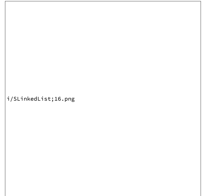
Fig. 2 : Liste (simplement) chaînée des jours ouvrables

l'extérieur, son contenu est totalement identique à celui du tableau-liste de la figure 1, mais en interne il est organisé de manière très différente.